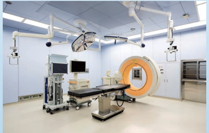
O-arm(術中断層撮影装置)