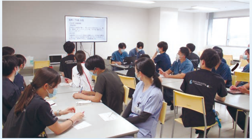
院内ハンズオンセミナー等 (随時開催)