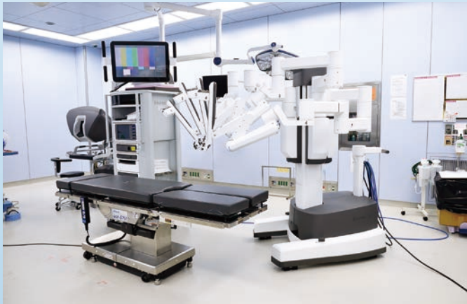
ダヴィンチ(手術支援ロボット)