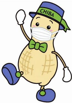
千葉ろうさい病院看護部 公式キャラクター