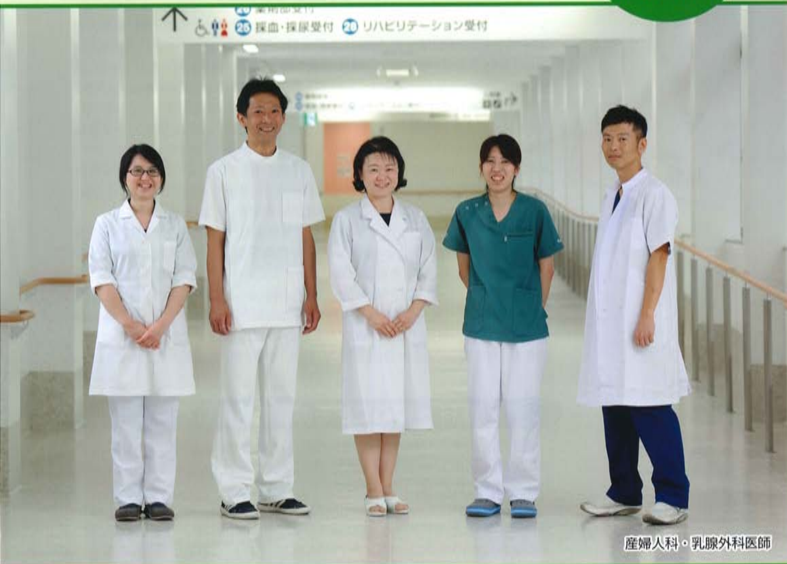
産婦人科・乳腺外科医師