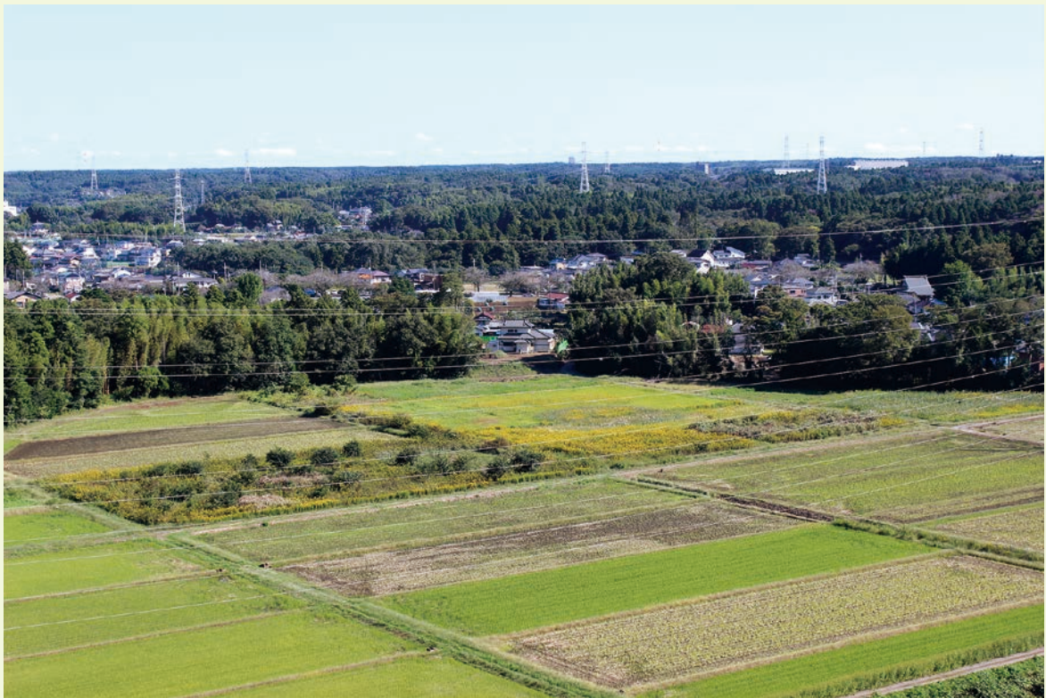
屋上から見える稲刈りを終えた田園風景。