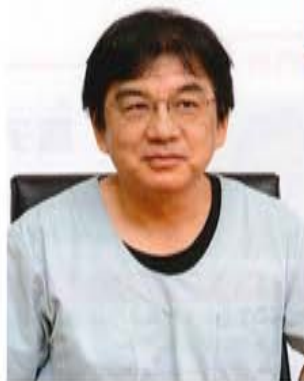
卒後臨床研修管理室 救急・集中治療部長