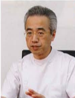
卒後臨床研修管理室 リハビリテーション科部長