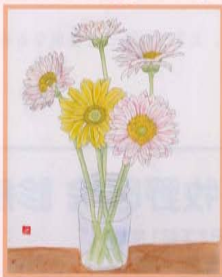
「ガーベラ」 作／杉田美雪さん