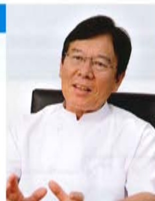
卒後臨床研修管理室 外科部長

現在の研修制度では「黙っていても教えてもらえる」という受け身の研修になりがちですので研修医には自らすすんで手術・検査等に参加したり指導医に積極的に質問をするように指導しています。また外科医となる医師が減少している昨今、手術の大変さ、厳しさを教えるのはもちろんですが手術の楽しさ、面白さも教え、一人でも多くの研修医が外科を目指してくれるよう指導することが我々外科医の責務と考えています。