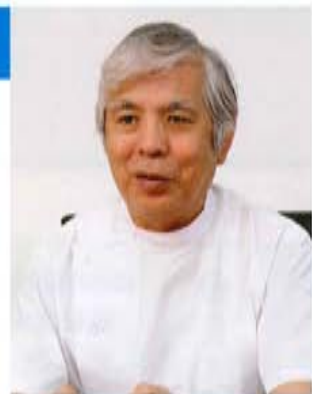
卒後臨床研修管理室 内科部長

研修に関しては年々学習する環境が整ってきていることを実感しています。卒後研修評価機構の認定はもちろん。さらにH26年度、希少なDPCⅡ群病院に認定されたこともその選定基準に医師研修の実施評価が含まれており、対外的にも研修環境が整っていることが認められています。400床という中規模病院ならではの診療科の垣根の低く相談しやすい環境、小回りの良さ、対応力の広さを感じ取って頂けたら良いと思います。ぜひ新しい病院で一緒に働きましょう。