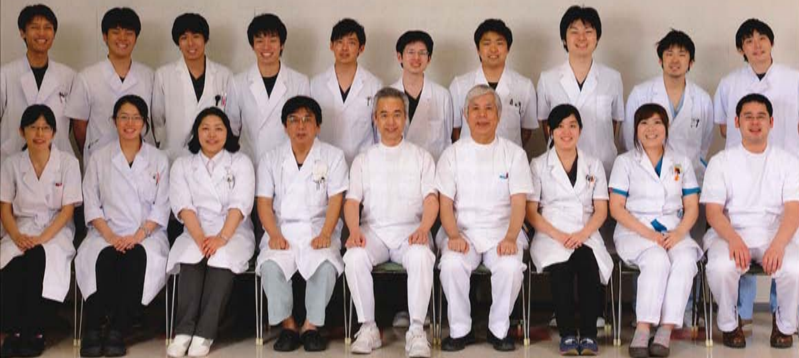
卒後臨床研修指導医と研修医